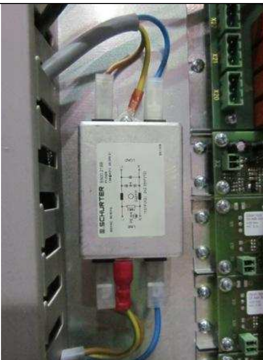
Montage / Anschrauben des Netzfilters (Anschlussbelegung lt. E-Plan auf Netzfilter) Mounting / bolting of the mains filter (pin assignment according to E-plan on mains filter.