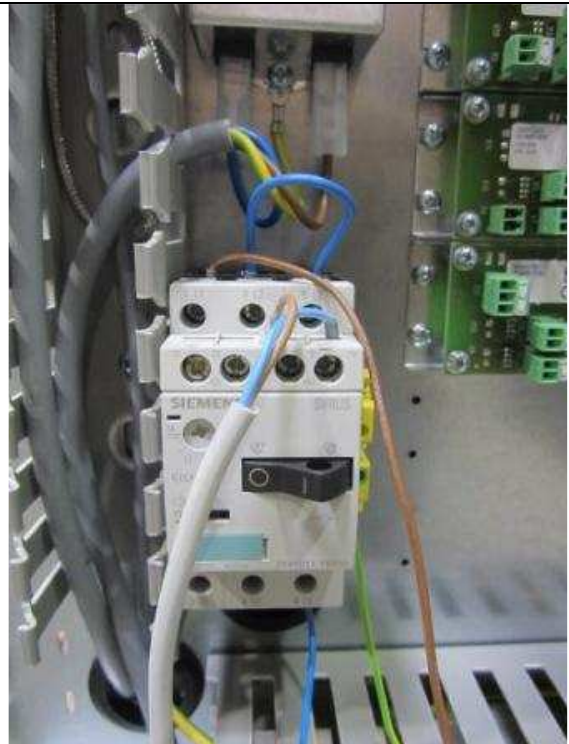
Montage des Motorschutzes auf Schnappschiene. Mount the engine protection on the mounting bar.